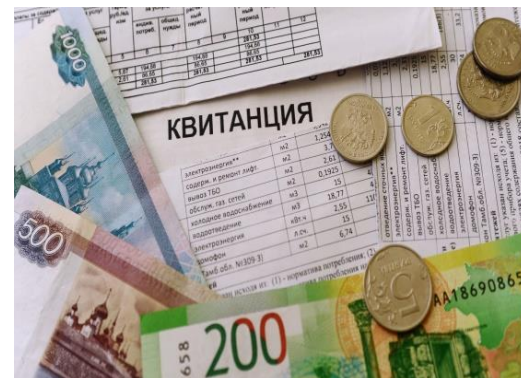
3. Средство платежа