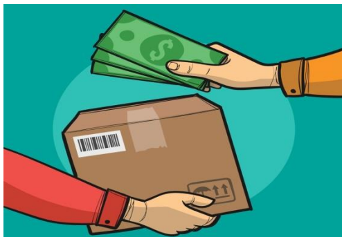
4. Средство обмена