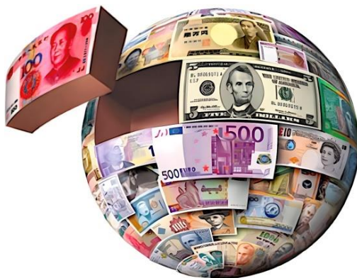
2. Мировые деньги