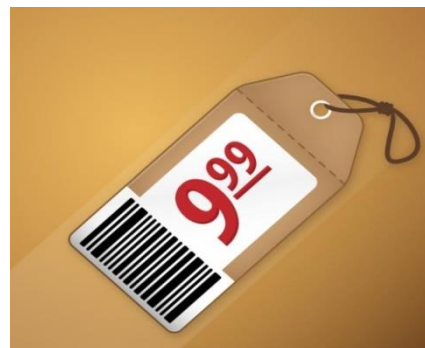
5. Мера стоимости