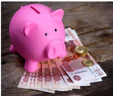
1. Средство накопления